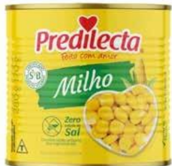
4050 Milho Latas 170g (Drenado) 24x170g