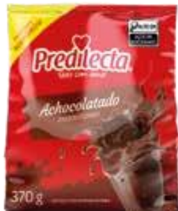
7184 Achocolatado em Pó Sachê 370g 24x370g