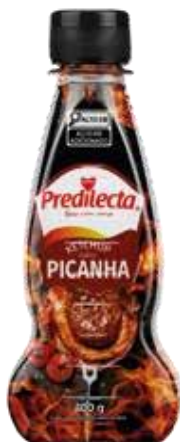
0302 Ketchup Picanha Bisnaga 400g 24x400g