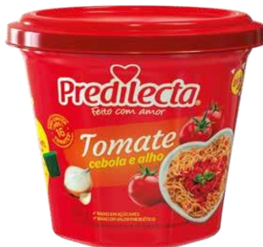
3461 Extrato de Tomate Cebola e Alho Bowl 300g 32x300g