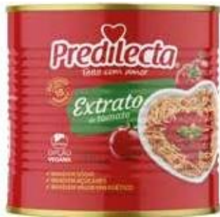
3038 Extrato de Tomate Lata 340g 24x340g