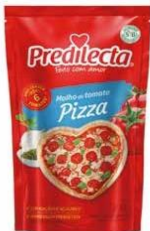
3411 Molho de Tomate para Pizza Stand Up Pouch 300g 32x300g