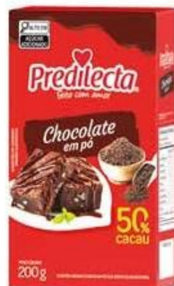
0599 Chocolate em Pó 50% Cacau 200g 24x200g