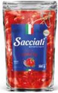
0664 Molho de Tomate Sant Up 300g 32x300g