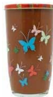
7032 Extrato de Tomate Decorado – Copo 260g 20x260g