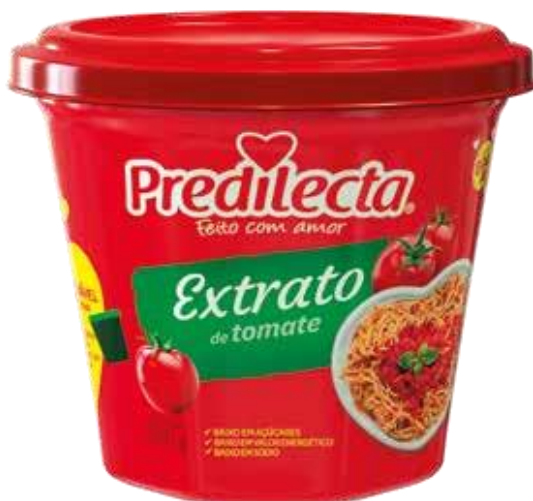
3460 Extrato de Tomate Bowl 300g 24x300g