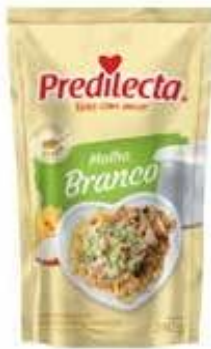
0951 Molho Branco Stand Up 240g 24x240g