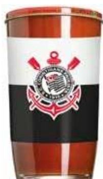
9780 Extrato de Tomate Corinthians Copo 270g 12x270g