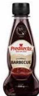
1060 Molho Barbecue Bisnaga 200g 24x200g