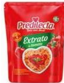
0314 Extrato de Tomate Stand Up Pouch 140g 48x140g