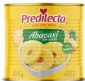
0229 Abacaxi em Calda Lata 400g 12x400g