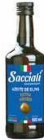
1512 Azeite de Oliva Extra Virgem 500ml 12x500ml