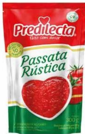
3413 Passata Rústica Stand Up Pouch 300g 32x300g