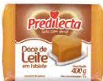
2029 Doce de Leite – Bloco 400g 24x400g