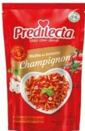
3401 Molho de Tomate Champignon Stand Up Pouch 300g 32x300g