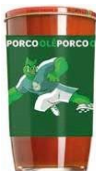
9781 Extrato de Tomate Palmeiras Copo 270g 12x270g