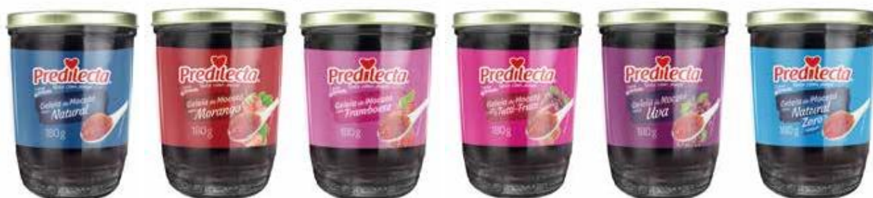
0548 Geleia de Mocotó Natural Vidro 180g 24x180g 0549 Geleia de Mocotó Morango Vidro 180g 24x180g 0550 Geleia de Mocotó Framboesa Vidro 180g 24x180g 0551 Geleia de Mocotó Tutti-Frutti Vidro 180g 24x180g 0552 Geleia de Mocotó Uva Vidro 180g 24x180g 0555 Geleia de Mocotó Zero Vidro 180g 24x180g