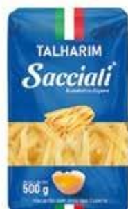
0267 Massa Caseira Talharim 500g 20x500g