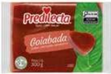
3006 Goiabada Flow Pack 300g 36x300g