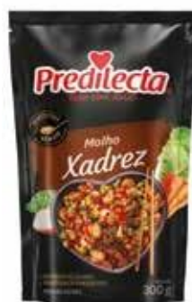
0900 Molho Xadrez Stand Up 300g 24x300g