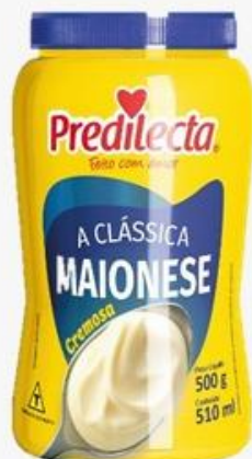
0781 Maionese Tradicional Pote 500g 12x500g