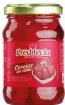
0319 Cereja em Calda Vidro 100g (drenado) 12x100g