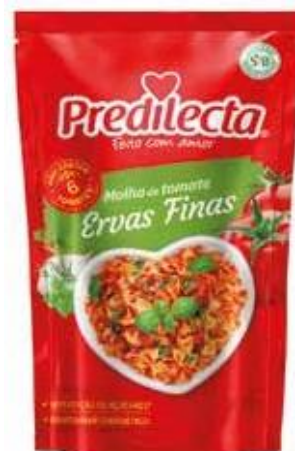
3403 Molho de Tomate Ervas Finas Stand Up Pouch 300g 32x300g