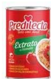
6038 Extrato de Tomate Lata 130g 48x130g