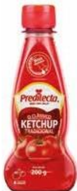
0141 Ketchup Tradicional Bisnaga 200g 24x200g