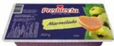
0292 Marmelada – Prática 350g 24x350g