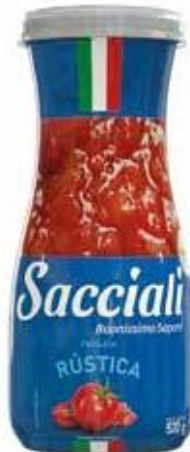
1334 Passata Rústica Decanter 520g 12x520g