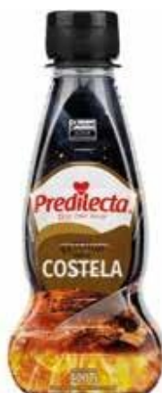
9297 Ketchup Costela Bisnaga 400g 24x400g