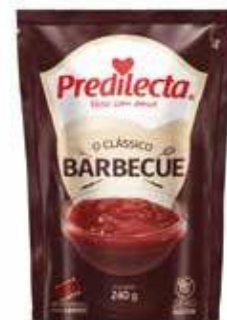
0949 Molho Barbecue Stand Up 240g 24x240g