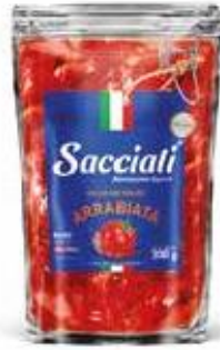
0665 Molho de Tomate Arrabiata Sant Up 300g 32x300g