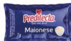
2143 Maionese Sachet 7g 144x7g