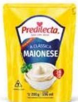
6043 Maionese Tradicional Stand Up 200g 24x200g