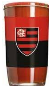
9784 Extrato de Tomate Flamengo Copo 270g 12x270g