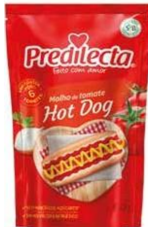
3405 Molho de Tomate Hot Dog Stand Up Pouch 300g 32x300g