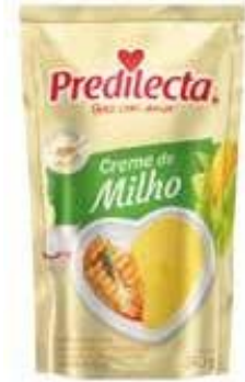
1003 Creme de Milho Stand Up 240g 24x240g