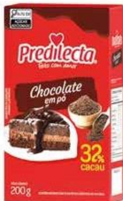
0598 Chocolate em Pó 32% Cacau 200g 24x200g