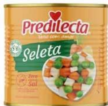
4778 Seleta de Legumes Latas 170g (Drenado) 24x170g