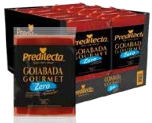
1900 Goiabada Zero Adição de Açúcar Bloco 300g 12x300g