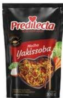
0754 Molho Yakissoba Stand Up 300g 24x300g