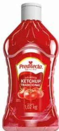
1536 Ketchup Tradicional Bisnaga 1,02kg 12x1,02kg