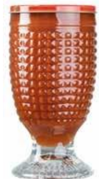
0190 Extrato de Tomate Taça 215g 15x215g