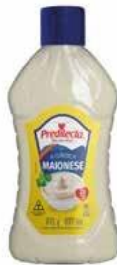
1687 Maionese Bisnaga 915g 12x915g