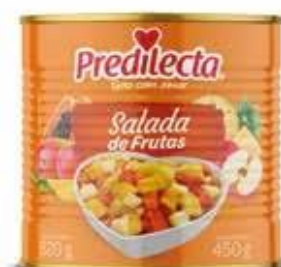
0502 Salada de Frutas em Calda Lata 450g 12x450g