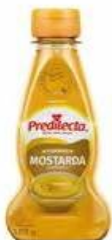
2247 Mostarda Preparada Bisnaga 180g 12x180g