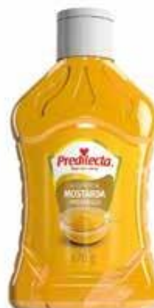
1365 Mostarda Bisnaga 670g 12x670g