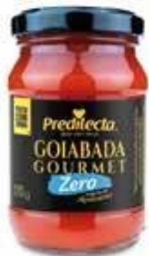
3009 Goiabada Zero Adição de Açúcar Vidro 220g 12x220g