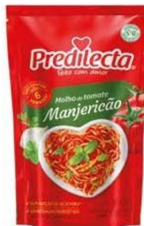
3407 Molho de Tomate Manjeriçao Stand Up Pouch 300g 32x300g