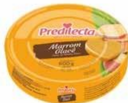
2209 Marrom Glacê – Lata 600g 12x600g