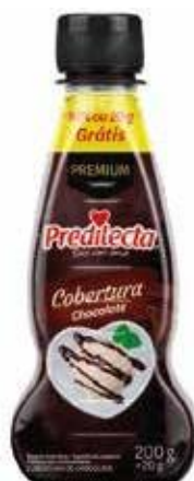
0362 Cobertura de Chocolate Bisnaga 200g 12x200g