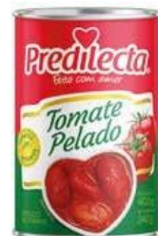
7200 Tomate Pelado Lata 400g 12x400g