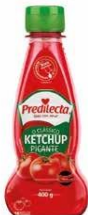
6046 Ketchup Picante Bisnaga 400g 24x400g