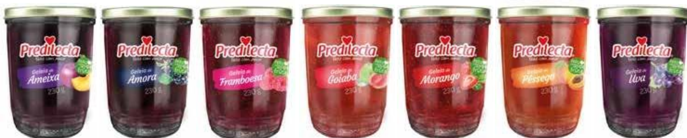
6018 Geleia de Ameixa Vidro 230g 15x230g 6013 Geleia de Amora Vidro 230g 15x230g 6097 Geleia de Framboesa Vidro 230g 15x230g 6010 Geleia de Goiaba Vidro 230g 15x230g 6011 Geleia de Morango Vidro 230g 15x230g 6070 Geleia de Pêssego Vidro 230g 15x230g 6014 Geleia de Uva Vidro 230g 15x230g