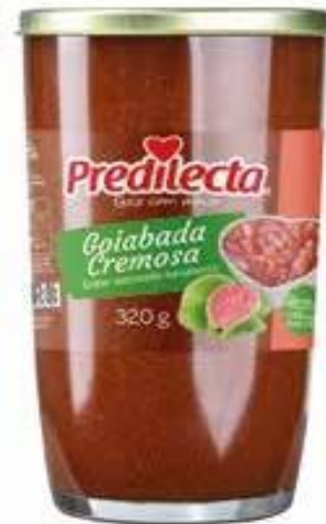
6022 Goiabada Cremosa Vidro 320g 15x320g