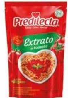
3312 Extrato de Tomate Stand Up Pouch 300g 32x300g