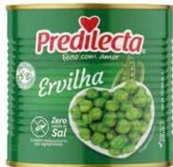
4054 Ervilha Latas 170g (Drenado) 24x170g