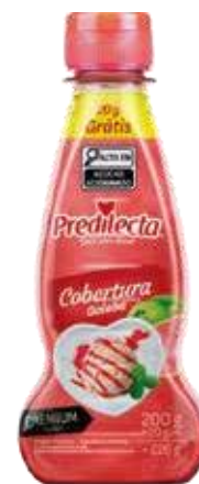
0362 Cobertura de Goiaba Bisnaga 200g 12x200g