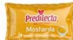
2447 Mostarda Sachet 5g 144x5g