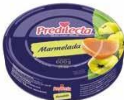
0139 Marmelada – Lata 600g 12x600g