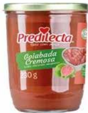
6022 Goiabada Cremosa Vidro 230g 15x230g