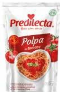
3317 Polpa de Tomate Stand Up Pouch 300g 32x300g