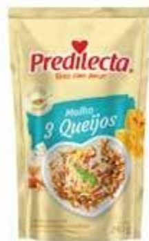
0955 Molho Três Queijos Stand Up 240g 24x240g