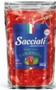
0667 Molho de Tomate Manjerona Sant Up 300g 32x300g