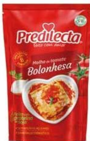
3399 Molho de Tomate Bolonhesa Stand Up Pouch 300g 32x300g