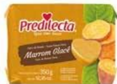
0288 Marrom Glacê – Bloco 350g 24x350g