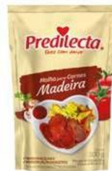
3429 Molho Madeira Stand Up 300g 32x300g