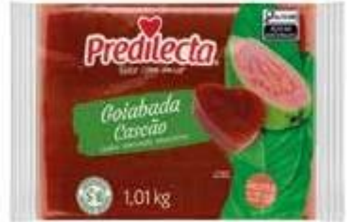
0007 Goiabada Flow Pack 1,01kg 16x1,01kg