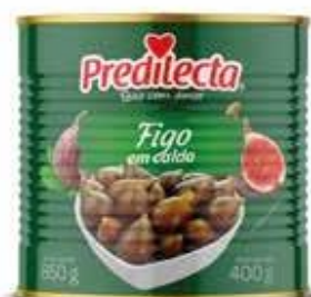
1070 Figo em Calda Lata 400g 12x400g