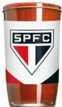
9782 Extrato de Tomate São Paulo Copo 270g 12x270g