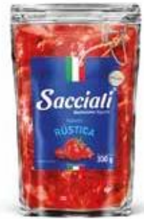
0680 Passata Rústica Sant Up 300g 32x300g