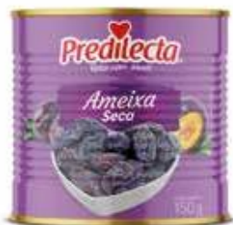
0562 Ameixa Seca Lata 150g 24x150g