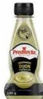
0603 Mostarda Dijon Bisnaga 180g 24x180g