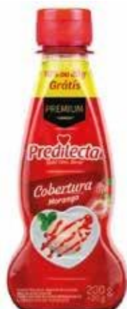
0207 Cobertura de Morango Bisnaga 200g 12x200g