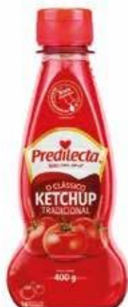
0046 Ketchup Tradicional Bisnaga 400g 24x400g