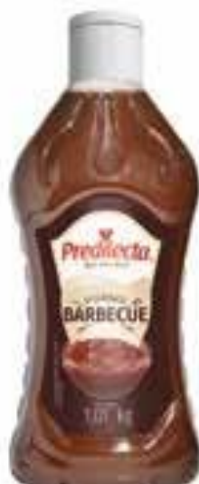
7157 Molho Barbecue Bisnaga 1,01kg 12x1,01kg