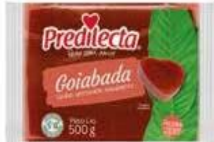
3020 Goiabada Flow Pack 500g 24x500g