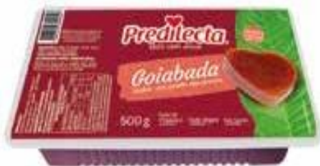
0020 Goiabada – Prática 500g 24x500g