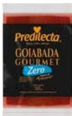
5105 Goiabada Zero Adição de Açúcar Bloco 500g 12x500g