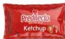
2146 Ketchup Sachet 7g 144x7g