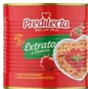
0366 Extrato de Tomate Lata 300g 24x300g