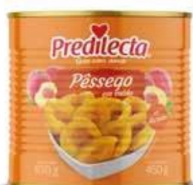
0135 Pêssego em Calda Lata 450g 12x450g