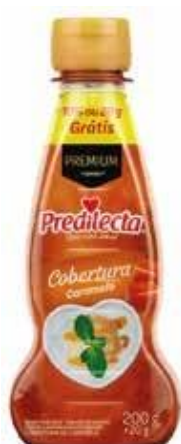
0362 Cobertura de Caramelo Bisnaga 200g 12x200g