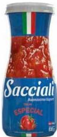
1333 Molho Especial Decanter 530g 12x530g