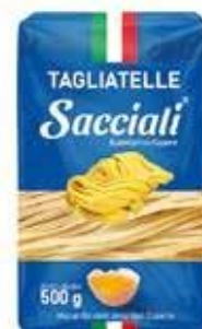
0268 Massa Caseira Tagliatelle 500g 20x500g