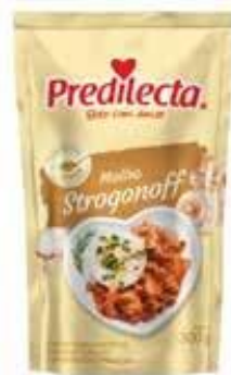
3428 Molho Stroganoff Stand Up 240g 24x240g