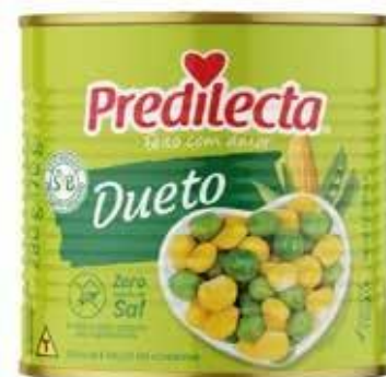
4807 Dueto Latas 170g (Drenado) 24x170g