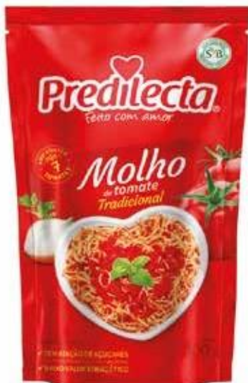
3322 Molho Refogado Stand Up Pouch 300g 40x300g