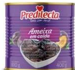
0560 Ameixa em Calda Lata 400g 12x400g