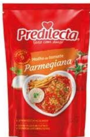
3409 Molho de Tomate Parmegiana Stand Up Pouch 300g 24x300g