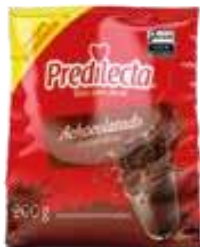
7183 Achocolatado em Pó Sachê 200g 48x200g