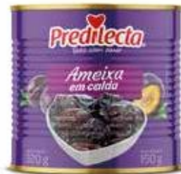
0561 Ameixa em Calda Lata 150g 24x150g