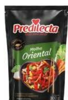
0901 Molho Oriental Stand Up 300g 24x300g