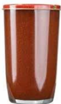
0142 Extrato de Tomate Liso - Copo 260g 20x260g