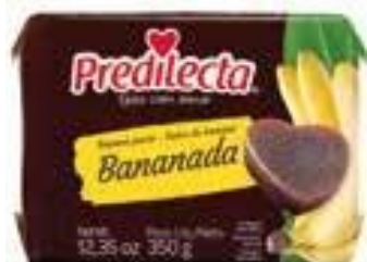
0091 Bananada – Bloco 350g 24x350g