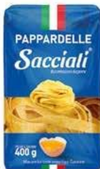
0266 Massa Caseira Pappardelli 400g 10x400g