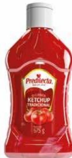
1535 Ketchup Tradicional Bisnaga 675g 12x675g