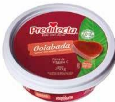
1596 Goiabada – Poli 250g 24x250g