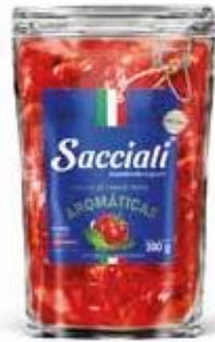
0666 Molho de Tomate Ervas Aromáticas Sant Up 300g 32x300g