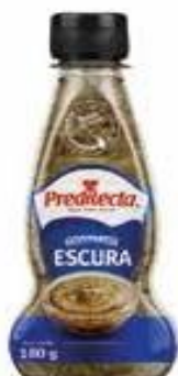
1061 Mostarda Escura Bisnaga 180g 24x180g