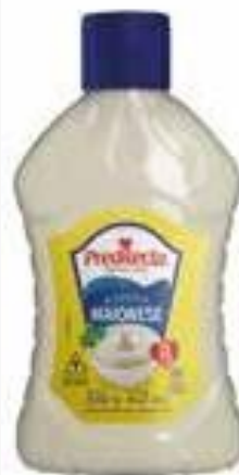
1686 Maionese Bisnaga 660g 12x660g