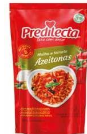
3398 Molho de Tomate Azeitonas Stand Up Pouch 300g 32x300g